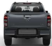
MAZDA BT-50 HIGH PLUS